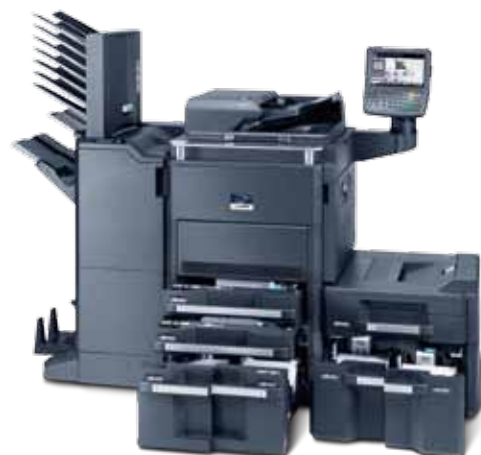
Izdelek na fotografiji ima vključene dodatke.

KYOCERA RA MITA Europe B.V. – Branch Office Germany – Otto-Hahn-Straße 12 – 40670 Meerbusch – Germany